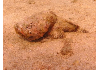
Valse Steenvis en soms

De vierde dag koerst de boot weer richting het natuurreservaat Ras Mohammed. Dit gebied kent talloze duikplaatsen die door duikers als geweldig, super, te gek en no1 worden aangeduid. Het meest bekende is ' Shark Reef & Yolanda' dat in veel top-10 lijstjes weer opduikt. De overvloed van de rif fauna en scholenvissen is uitzonderlijk en de verscheidenheid van het mariene milieu is fascinerend. Je wordt omringd door scholen van de Twin Spot Snapper, Giant Trevally, Barracuda en Batfish. Het is een klassieke ' drift dive' waar je start langs de voorkant van een 750m steile wand van Shark Reef, over een kam (de 'Saddle') rond het plateau van Yolanda en afsluit rond het wrak van de Yolanda. De Yolanda was een koopvaardijsschip dat zonk in april 1980 en een lading aan boord had van badkuipen, wasbakken, toiletpotten en alles wat te maken heeft met een badkamer of toilet! Het is een geweldige plek voor het spotten van Blue Spotted Stingrays, murenen en schorpioenvissen. Hoewel we deze dag nagenoeg geen stroming hadden, moeten duikers zich bewust zijn van sterke stromingen sterke ondergrond.